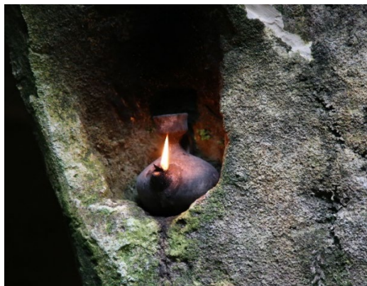
Carpignano Salentino, Frantoio Ipogeo, (In ordine ) Ingresso al frantoio, Vasca di macinatura, stive delle olive, torchi e pozzi di raccolta, particolari del torchio alla calabrese e del torchio alla genovese, lucerna, ph. Paola Durante, 2026