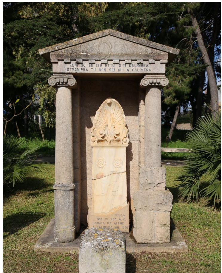
Calimera, Villa Comunale, Viste della villa comunale, particolare della Stele Attica, ph. Paola Durante, 2026