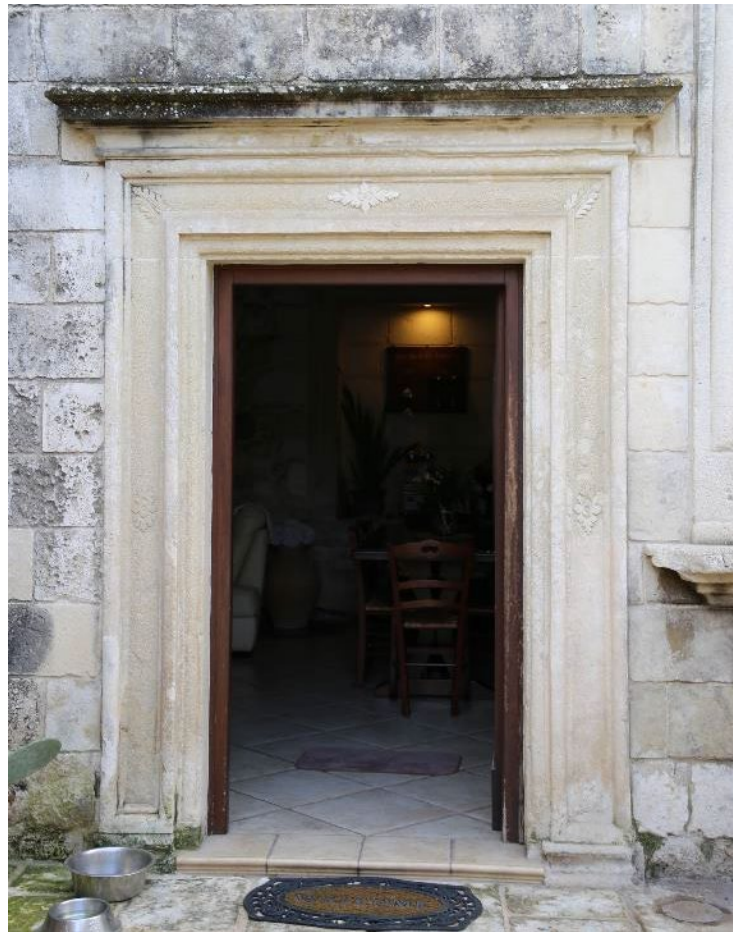
Castrignano de' Greci, Casa a corte (Ex Abbazia), Prospetto Principale, Corte, Particolari delle volte, Portale di ingresso, Ph. Paola Durante, 2026